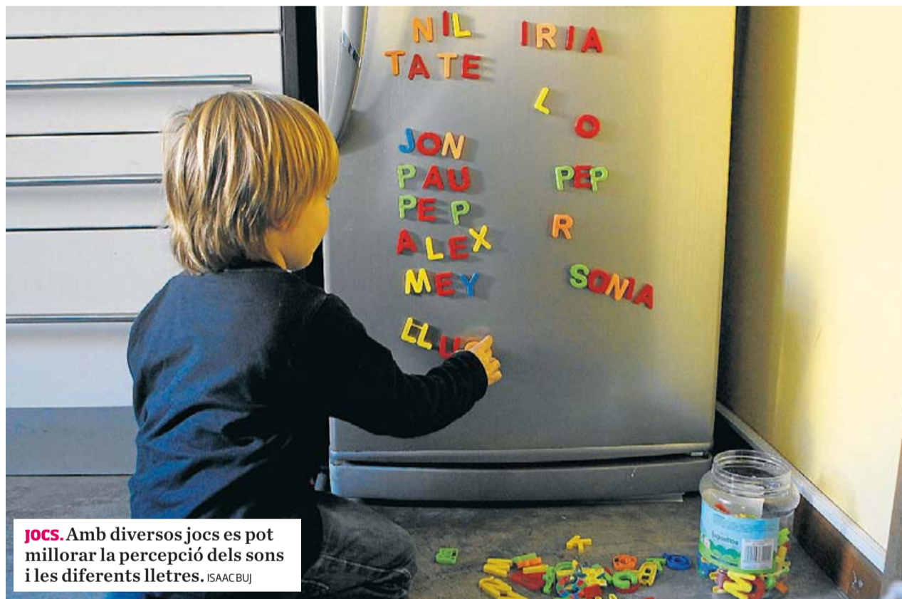
Jocs. Amb diversos jocs es pot millorar la percepció dels sons i les diferents lletres. ISAACBUJ

La consciència fonològica és l'habilitat de percebre i manipular les peces sonores del sistema de sons d'una llengua, o sigui, les unitats que anomenem fonològiques, com ara la paraula, la síl·laba o el fonema, entre d'altres. Un dels pri-